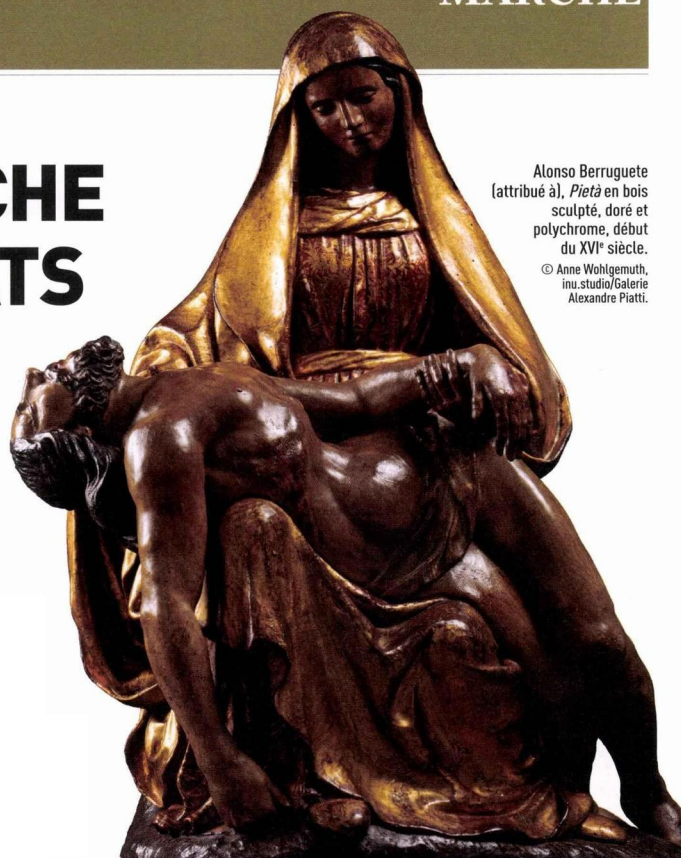
Alonso Berruguete (attribué à), Pietà en bois sculpté, doré et polychrome, début du XVI e siècle.

Du 8 au 12 juin, le Carré Rive Gauche invite les visiteurs à arpenter les 6 e et 7 e arrondissements de Paris à la découverte d'une sélection d'œuvres exposées dans les galeries et antiquaires