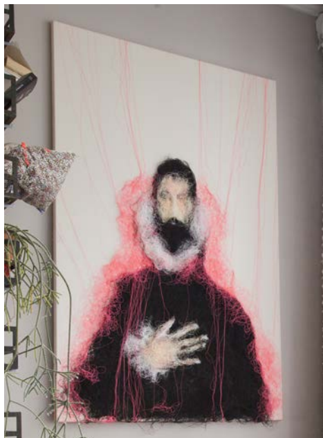
La Main sur le Coeur , 145 x 100 cm, 2017

Mathieu Ducournau est né au Maroc, il vit et travaille à Paris. Artiste intuitif et hors norme, il explore seul les possibilités de la peinture avant de rencontrer le fil et le potentiel de la machine à coudre. Il expose régulièrement depuis 1996, et collabore également avec des Maisons de Luxe françaises telles que Taillardat ou Hermès. En septembre 2017, Il réalise la mise en scène du lancement d'un nouveau parfum dans la boutique Hermès de la rue de Sèvres, à Paris.