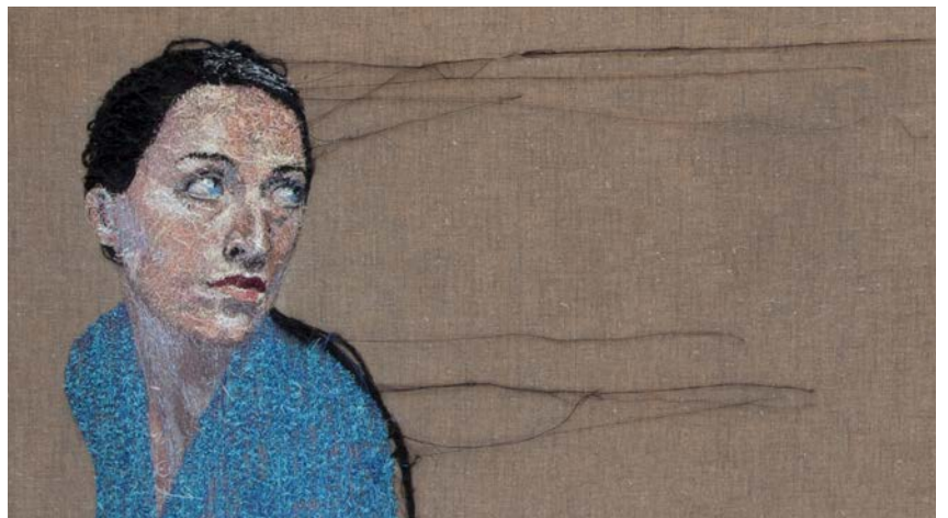
Siv Tone - 118 x 143 cm, 2014 (détail)