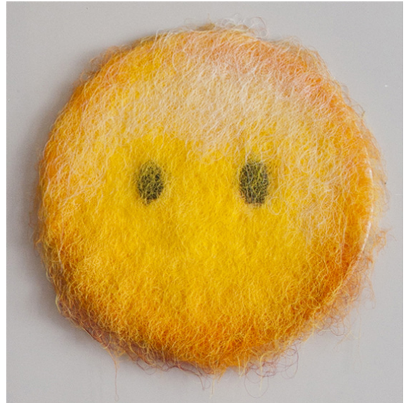
Smiley - Ø 60 cm, 2017

Avec la série des Anonymes, l'artiste transfigure chaque détail, jusqu'à faire ressortir la personnalité du modèle. Puis l'artiste poursuit l'exploration de la représentation du portrait à travers les époques, avec quelques grandes figures de la mémoire collective. De Velázquez, à Vinci, de Rembrandt au Greco, en passant par l'icône contemporaine par excellence : l'émoticône.