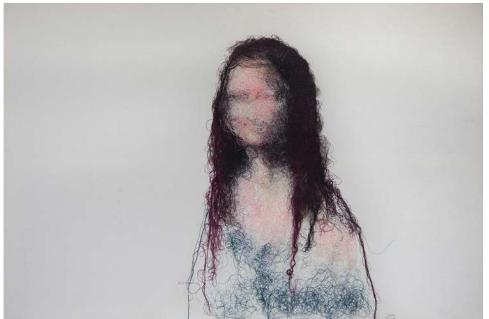
Joconde#2 - 100 x 145 cm, 2017