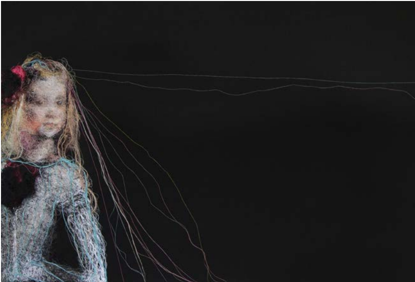
Menine - 100 x 145 cm, 2017

D'une part, il y a les topographies, qui sont comme des reliefs abstraits où chacun peut apercevoir ce qu'il souhaite y voir... et d'autre part, les portraits. La thématique du portrait s'inscrit dans une tradition picturale mais petit à petit, le motif va migrer, se détacher, tel un Suaire contemporain !