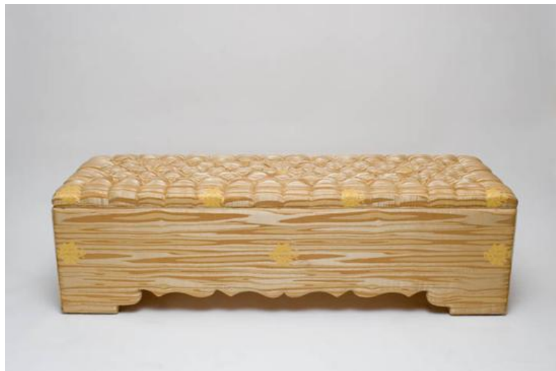
MINALE MAEDA SURVIVAL BENCH

Olivier utilise la technologie et l'impression 3D, et l'applique à la céramique ce qui lui permet de réaliser des pièces aux motifs complexes, impossibles à réaliser sans l'aide de machines. Il réintroduit un aléa, dans le procès de production des erreurs pour redonner une humanité et créer ainsi des objets singuliers