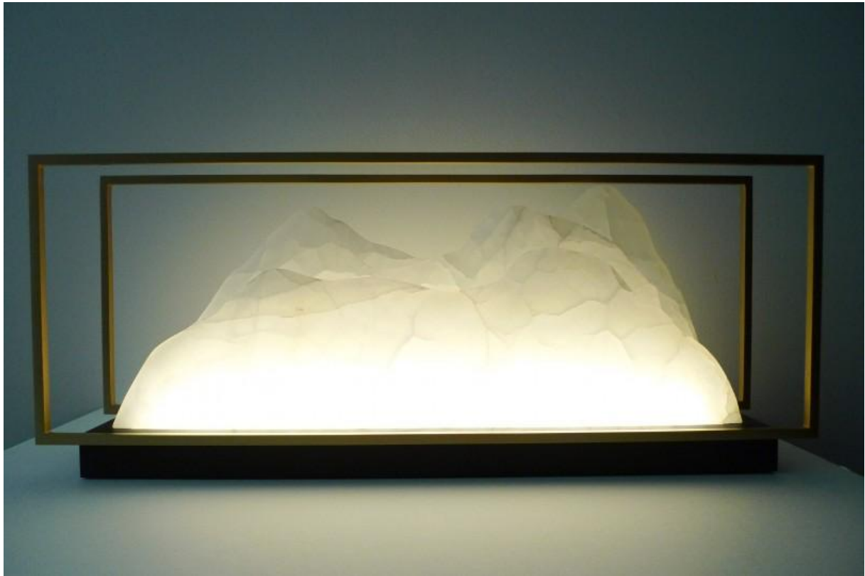
ERIC GIZARD LAMPE SHAN 2016 Onyx blanc, laiton massif brossé, aluminium anodisé. 55 x 9,6 x 20 cm Pièce unique