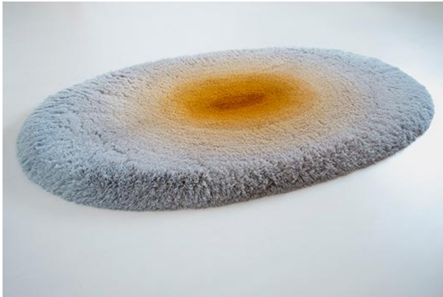
TIJMEN SMEULDERS RUG