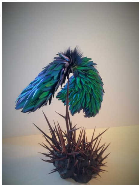
ROMAIN VAYSON DE PRADENNE SCULPTURES CHIMERIQUES Elytres de scarabée, épines, plumes, argile cellulosique, peinture.