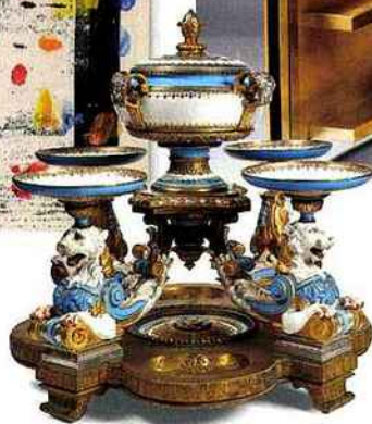
Rare surtout de table en porcelaine anglaise de Minton sur socle en bronze, XIX e siècle. Galerie Pla.