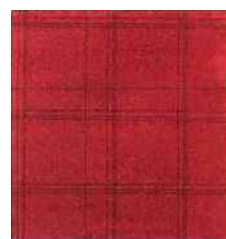
2 trames de lignes perpendiculaires (1952). Laque sur bois. 60 x 60 cm François Morellet. Est. : 120 000-180 000 €.

PARIS (VIII e ) 2 et 3 juin. Deux très belles ventes d'art contemporain et une d'art impressionniste et moderne au programme de la maison de ventes Sotheby's.