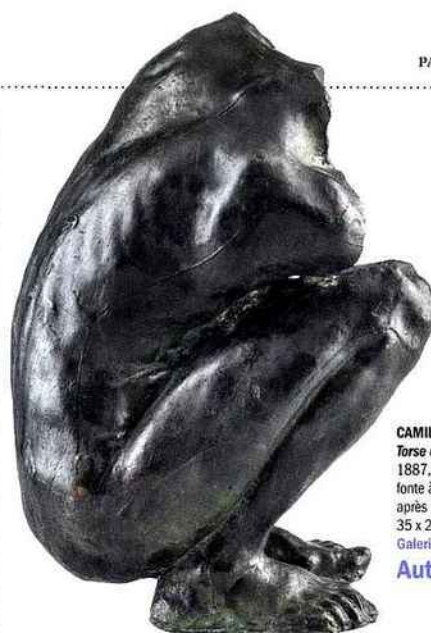
CAMILLE CLAUDEL Torse de femme accroupie 1887, épreuve en bronze, fonte à la cire perdue après mars 1913, 35 x 21 x 19 cm. Galerie Malaquais, Paris Autour de 2 M€