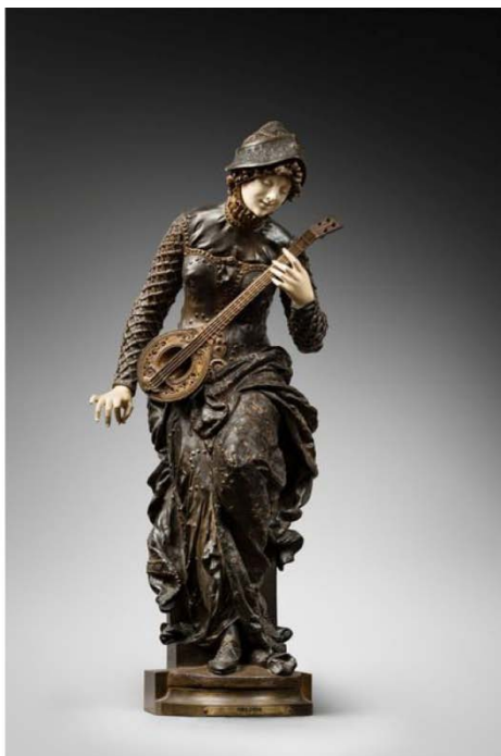
Douce Mélodie Bronze chrysléphantin de Louis Carrier Belleuse (1848-1913). Galerie Alain et Gérard.

En parcourant sous une pluie hivernale les galeries du Carré Rive Gauche , je ne pouvais m'empêcher de siffloter la célèbre chanson de Serge Lama « Femme, femme, femme, fais-nous voir le ciel. Femme, femme, femme, fais-nous du soleil. Femme, femme, femme fais-nous voir l'amour... ». Pour fêter les quarante ans de sa manifestation de printemps, les antiquaires et galeries du Carré ont en effet choisi pour thème la femme.