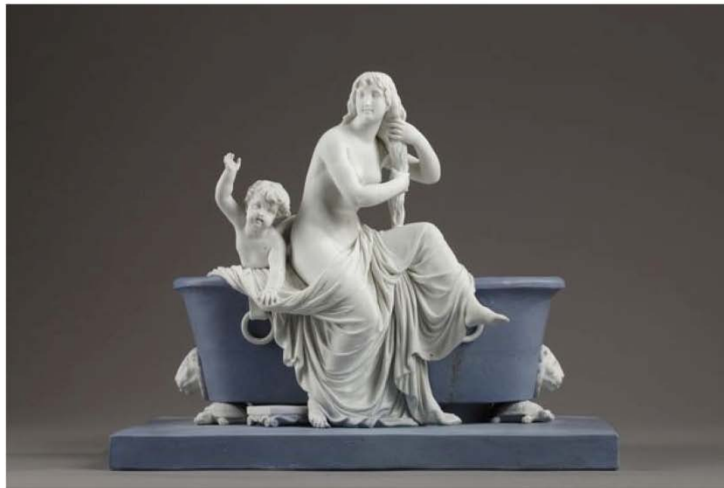
Femme au bain, 1799, groupe modelé par Boizot. Biscuit de Sèvres deux couleurs. Galerie Théorème.

En parcourant sous une pluie hivernale les galeries du Carré Rive Gauche , je ne pouvais m'empêcher de siffloter la célèbre chanson de Serge Lama « Femme, femme, femme, fais-nous voir le ciel. Femme, femme, femme, fais-nous du soleil. Femme, femme, femme fais-nous voir l'amour... ». Pour fêter les quarante ans de sa manifestation de printemps, les antiquaires et galeries du Carré ont en effet choisi pour thème la femme.