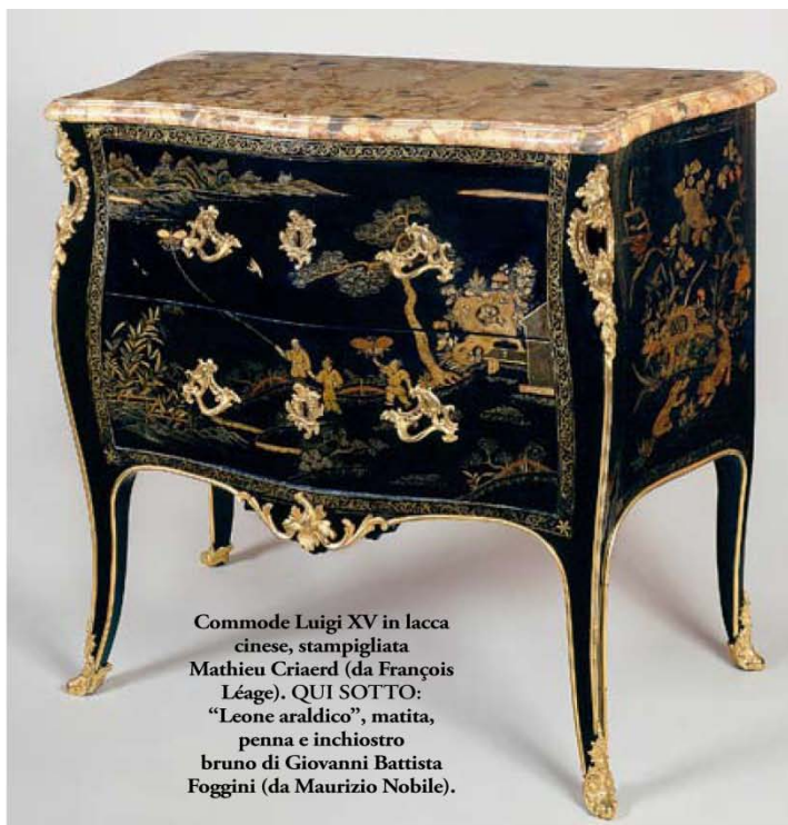
Commode Luigi XV in lacca cinese, stampigliata Mathieu Criaerd (da François Léage). QUI SOTTO: "Leone araldico", matita, penna e inchiostro bruno di Giovanni Battista Foggini (da Maurizio Nobile).