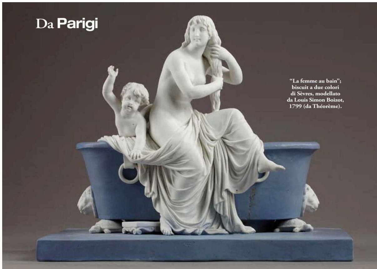
“La femme au bain”; biscuit a due colori di Sèvres, modellato da Louis Simon Boizot, 1799.