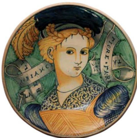
SOPRA: coppa di fidanzamento in maiolica, Acquapendente, fine XVI secolo (da JM Béalu et Fils).

N asce 7 days in Paris art-antiques-design , iniziativa congiunta delle associazioni Carré Rive gauche, Nocturne Rive droite, Art Saint-Germain-des-Prés e D’Days festival du Design, quest’ultima riservata esclusivamente al design contemporaneo. Sono oltre 400 le gallerie che partecipano agli eventi organizzati dal 30 maggio al 5 giugno , con l’intenzione di offrire a Parigi il più grande salone artistico a cielo aperto. «Abbiamo pensato di riunire le nostre forze, “armonizzando” in un unico periodo le iniziative legate